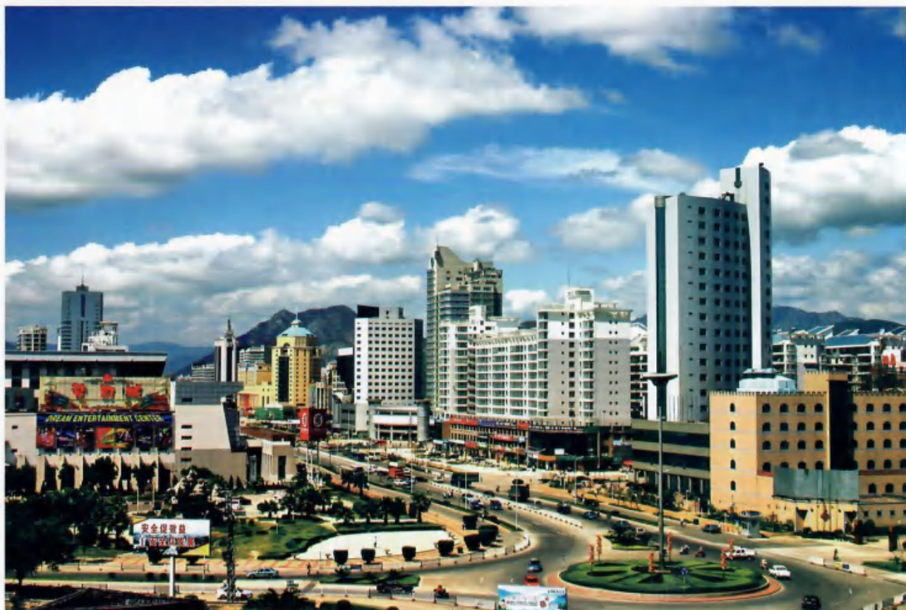
西区新貌

经过二十年的发展建设，融侨经济开发区涌现出一批又一批重点知名企业，有以显示器产量全球第一的冠捷公司，有打响美国汽车玻璃反倾销第一案的福耀集团。全区2006年年产值超亿元的企业达35家，区内已拥有中国名牌产品2个、中国驰名商标2件，福建省名牌产品18个、著名商标5件。截止今年6月，全区累计批准各类企业543家，总投资38亿美元。开发区用不到1%的土地，产生了福清市逾70%的工业产值、90%的出口总值和40%的财税收入。