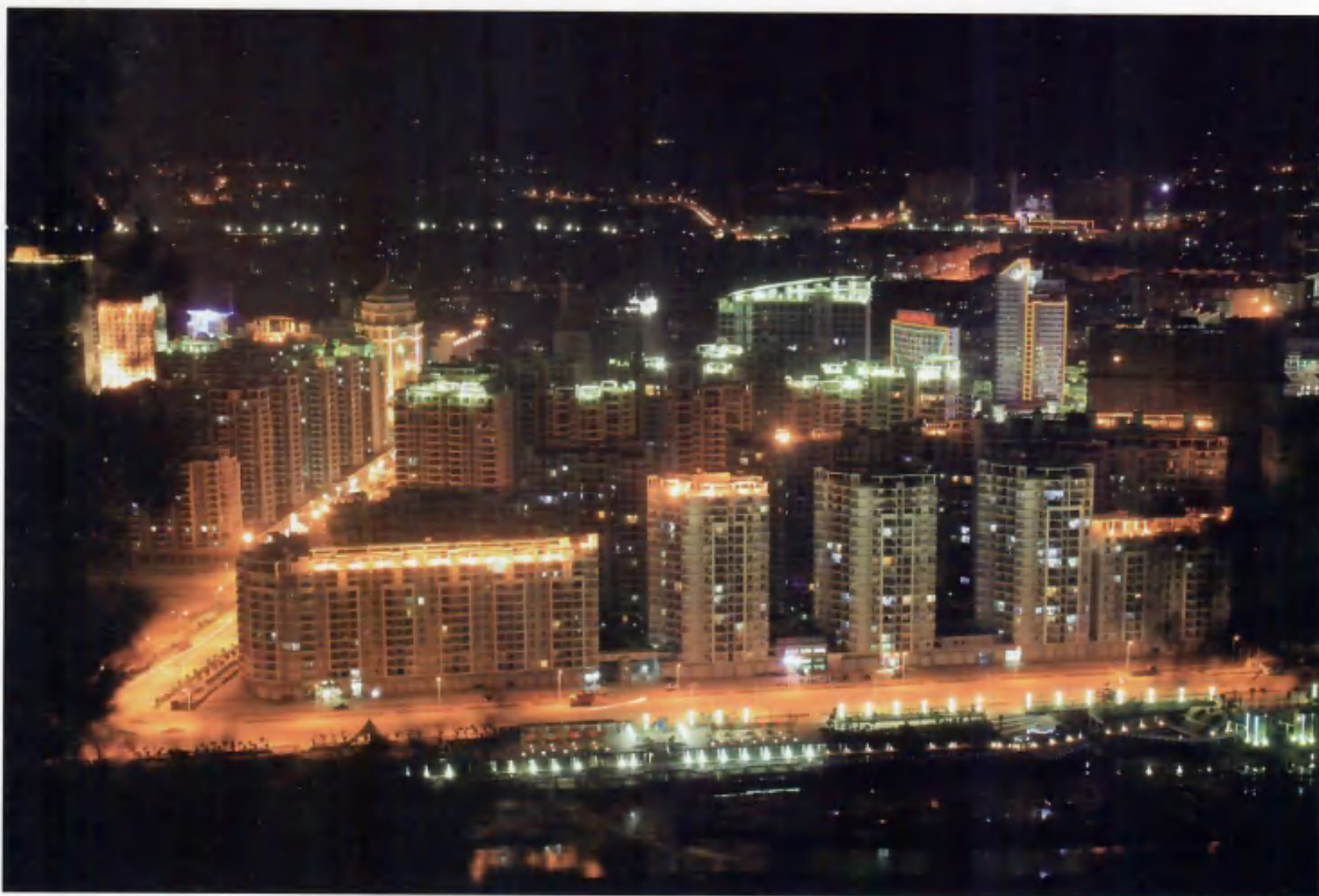
西门新区夜色

乃至福建的重要经济增长点和外向型经济的重要基地。1997年前后，全区企业中侨资占了六成，台资企业占到36%。洪宽工业村台资企业集中，现有台资企业95家，行业涉及六大门类47个品种，被海内外媒体誉为“小台湾村”。开发区由此形成了侨为依托、“以侨引台、以台促侨、侨台港外联合开发”的良好发展态势，实现了产品质量上的大提升和经济效益上的大飞跃。