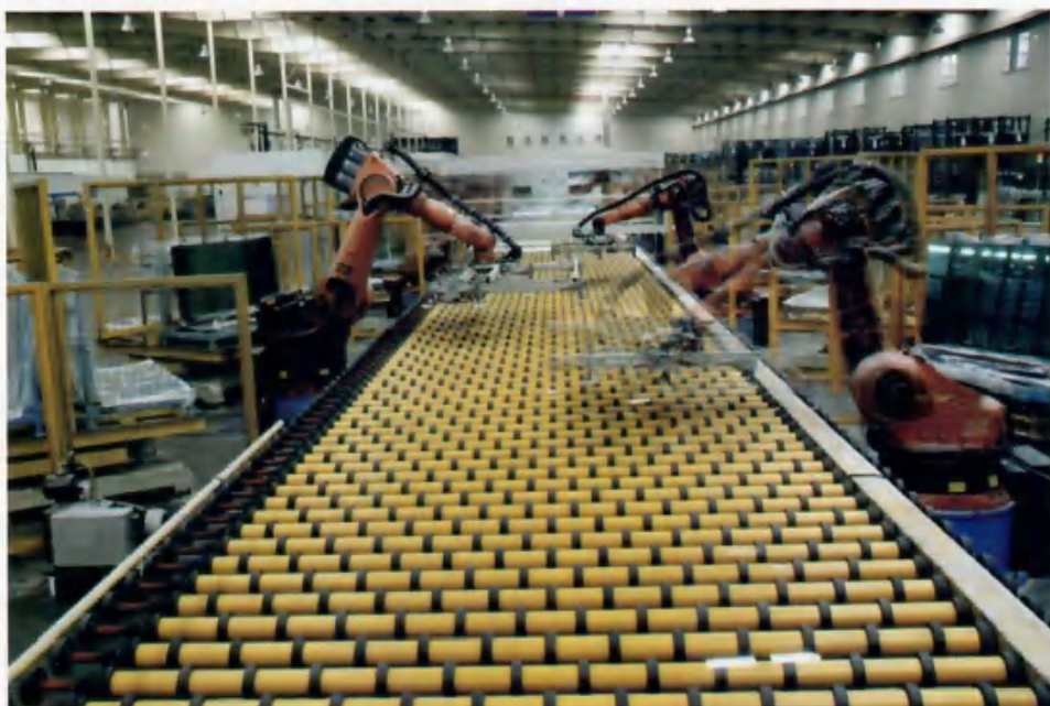
福耀车间