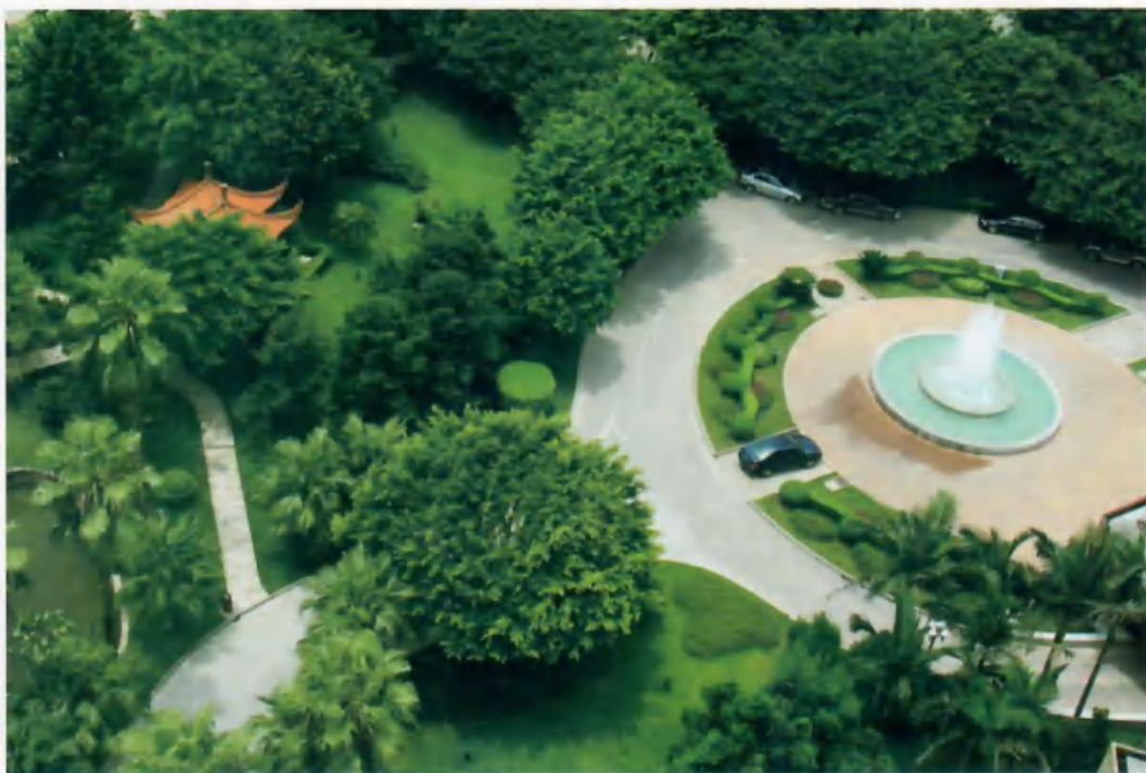
融侨大酒店园林

二十年艰苦创业，二十年风雨砥砺；二十年拼搏争先，二十年春华秋实。融侨经济开发区在众多海内外乡亲的呵护中不断成长、壮大，产品不断从“福清制造”到“福建制造”再到“中国制造”的飞跃，并跨出国门走向世界。海内外玉融儿女的辛勤耕耘得到了丰厚回报，他们用勤劳的双手在海峡西岸托起今日的辉煌。