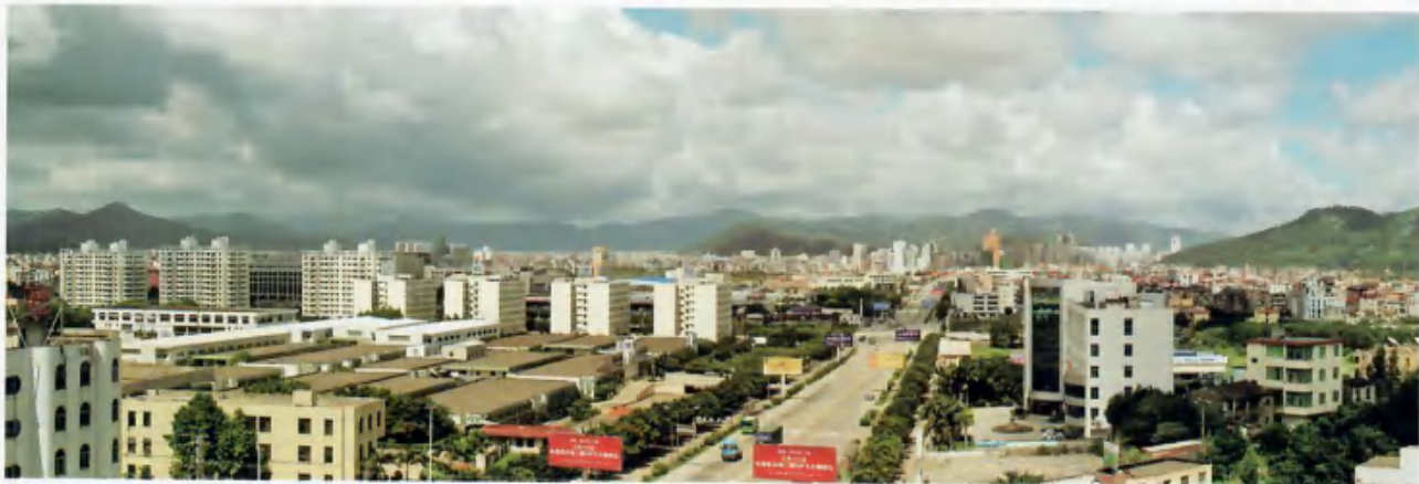
融侨经济开发区