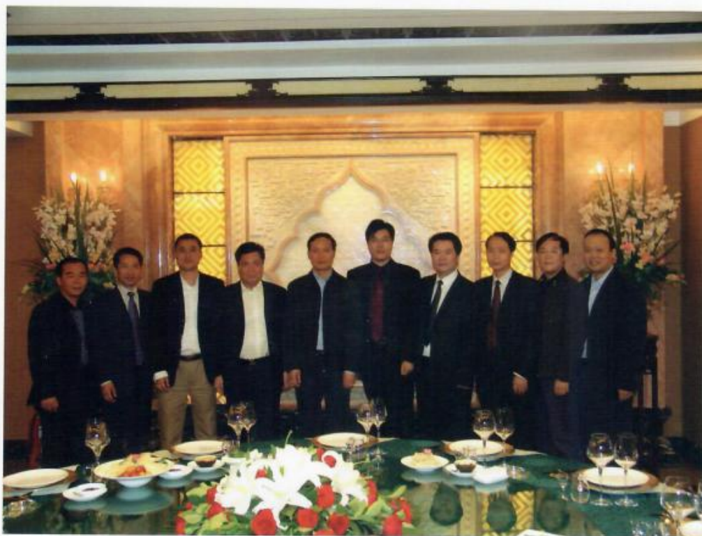
福州市委书记袁荣祥与福州商会领导成员会面

10月14日，党的第十七次代表大会召开前夕，福州市委书记袁荣祥在北京亲切会见了北京福州商会的企业家代表。