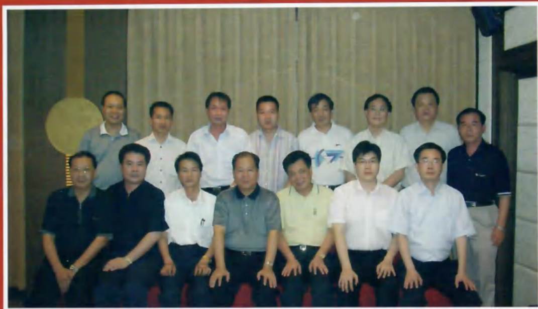
福州市郑松岩市长会见北京福州商会主要领导及北京福州商会筹委会成员