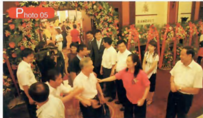
Photo 05 欢送与会代表及各界嘉宾