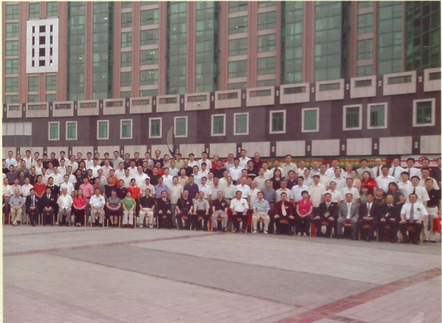
北京福州商会成立大会合影留念