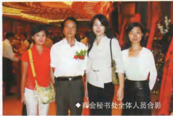
◆ 商会秘书处全体人员合影